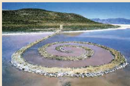
Robert Smithson, Spiral Jetty , 1970